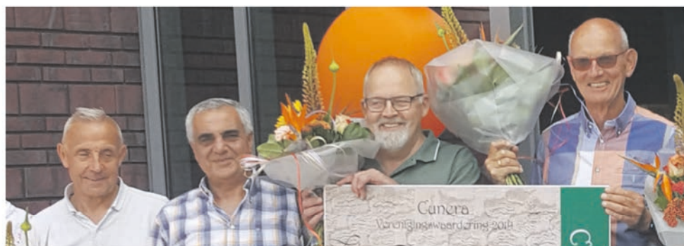
Een aantal vrijwilligers van de Formulierbrigade tijdens de uitreiking van de ing Cunera Vereniging Waarderingsprijs

Eventueel kan men inspreken waarna men zo spoedig mogelijk wordt teruggebeld. Hoewel het niet mogelijk is om direct met elkaar in contact te komen, zijn er allerlei mogelijkheden om dit op te lossen. Dat kan b.v. door een kopie van een brief/formulier op een afgesproken tijdstip bij de Westpoort te bezorgen, of om deze te mailen, of misschien kan er al telefonisch hulp worden geboden.