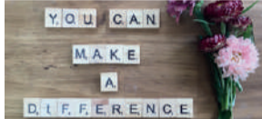
You can make a difference P7