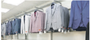
Maatpakken van Atelier het Hof P3