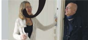
't Brandtweer P8