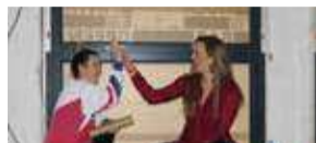
Nieuwe hotspot in Rhenen P5