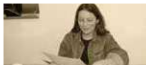
Senna oskam P2