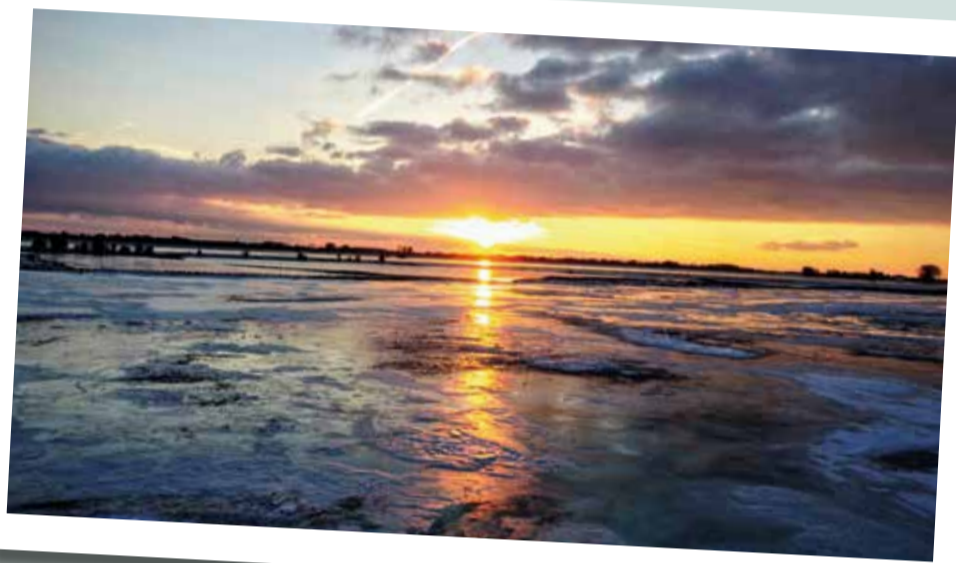
In de leeftijdscategorie 8 tot 18 jaar is Milo Germanus de winnaar.

De kinderen en jongeren die een foto hebben ingezonden voor de wedstrijd, krijgen als extra prijs een workshop aangeboden. Zij mogen een middag op stap met fotograaf Erik Helmers en krijgen leuke tips. De foto's van de winnaars en de foto's die het nét niet geworden zijn, zijn te zien op de Facebookpagina van het Cultuurplatform Rhenen.