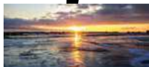
Fotowedstrijd mooi Rhenen P6

ONTSLAG? Advocatenkantoor WOLTERS www.advocatenkantoorwolters.nl