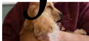
Met je handen in het dierenhaar P13