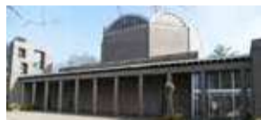
Stichting vrienden van de gedachteniskerk P11