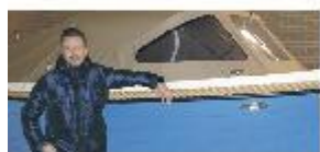
Een jonge man met ambitie P2