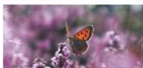
Durf jij om je heen te kijken? P5