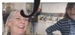
Een woensdagmorgen in de werkplaats P7

Gemeente Neder-Betuwe | Gemeente Rhenen Ingen | Lienden | Ommeren