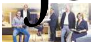
Morgana in lockdown compleet verbouwd P9