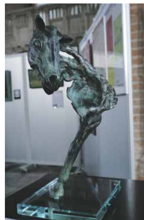
3. Sandra Pot, Cheval (2019)

Stadsmuseum Rhenen Markt 20, Rhenen T 0317-612077 Open: di t/m za van 10-16 uur Museumkaart geldig www.stadsmuseumrhenen.nl