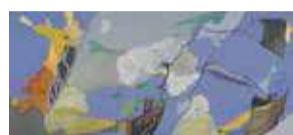
Kunstenaars in de kijker P4