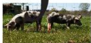
Weet u waar uw eten vandaan komt? P4