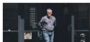
Een andere kijk op de wereld P2