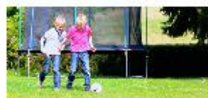
Revaliderende moeder zoekt steun P3