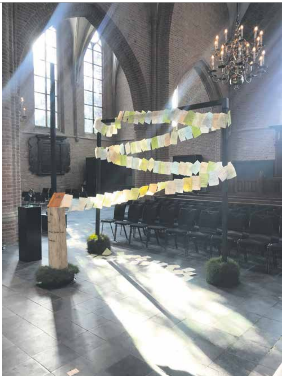
Initiatief van Kunstenaar van het Jaar 2020 Mascha Bossuyt meer info: www.thinkpink.studio/rhenenverbindt

Meer informatie: www.thinkpink.studio/rhenenverbindt