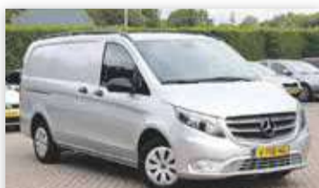
Mercedes-Benz Vito 114 136pk CDI Lang Business Ambition Aut.