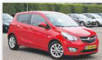
Opel KARL 1.0 ecoFLEX Innovation