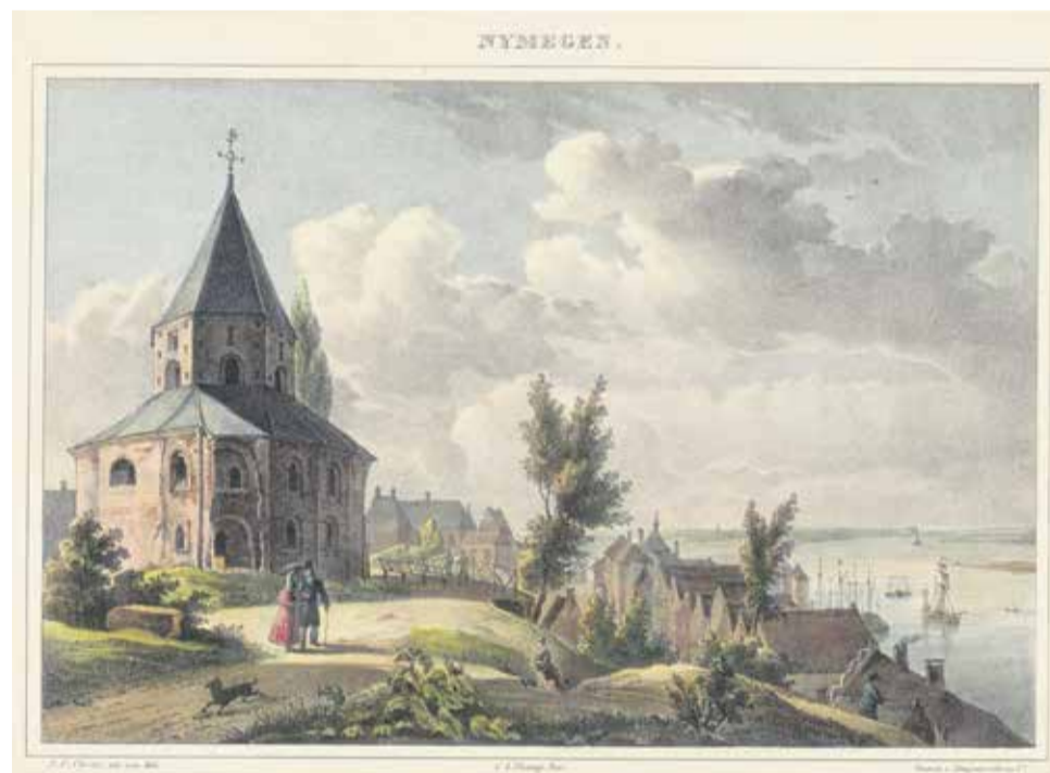
J.F. Christ, Sint-Nicolaaskapel in Nijmegen , prent (in 1834 uitgegeven door C.A. Vieweg), Rijksmuseum

Verrassingen en eyeopeners. Gezicht op de Rijnpoort te Rhenen is prominent op zaal aanwezig. Het wordt daar behandeld door