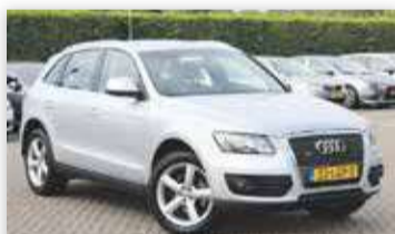
Audi Q5 2.0 211pk TFSI quattro Pro Line S Line