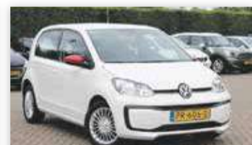
Volkswagen up! 1.0 60pk BMT move up!