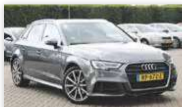
Audi A3 Sportback 1.0 116pk TFSI Sport S Line Edition