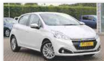
Peugeot 208 1.2 PureTech Blue Lease Executive