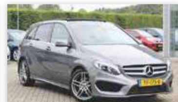
Mercedes-Benz B-Klasse 180 Business Solution AMG