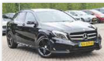
Mercedes-Benz GLA-Klasse 180 Premium Plus AMG-pakket