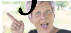
Rhenen Verbindt P17