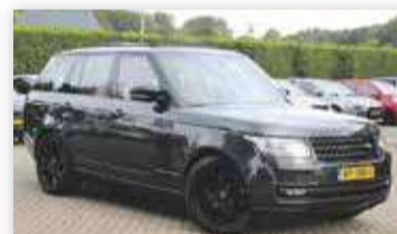
Land Rover Range Rover 3.0 TDV6 Autobiography