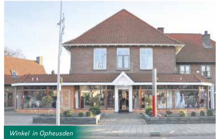
Winkel in Opheusden

In 1989 heeft hij besloten een winkel in dames- en herenkleding te openen in Ederveen. Een imposant pand aan Bruinehorst nummer 23. In 2014 heeft hij een tweede vestiging geopend in Opheusden aan de Burg. Lodderstraat 52 in Opheusden. Op de damesafdeling treft u een mix van jong sportief en klassiek gekleed. Volop keuze voor elke gelegenheid. De collectie bestaat uitsluitend uit kwaliteitsmerken o.a. Gerry Weber, Frankwalder Gollehaug, Sommermann, Hermann Lange, Erfo, Question, Bloomings, Signe Nature, B-Three.