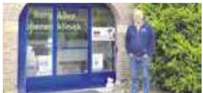
Berg&Bos, kliniek voor alle dieren P6