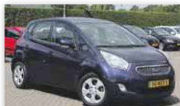
Kia Venga 1.6 CVVT X-ecutive Automaat 1e Eig.