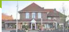
In de schijnwerper: Warring Kleding P20

Gemeente Neder-Betuwe | Gemeente Rhenen Ingen | Lienden | Ommeren