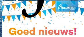
Goed nieuws! Glasvezel voor Achter- berg, Elst en Rhenen! P12