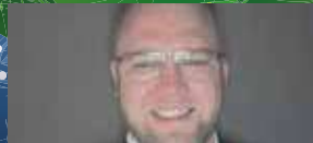
Eigenwijze nieuwjaarsgroot P18