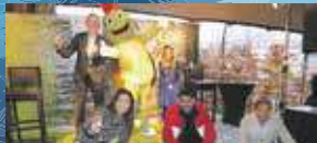
Onki Donki alles begint bij een kind P11