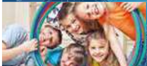
Buurtgezinnen zoeken Steungezinnen P10

Gemeente Neder-Betuwe | Gemeente Rhenen Ingen | Lienden | Ommeren