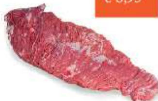
Vleesboerderij het Binnenveld Ribeye 200 gram