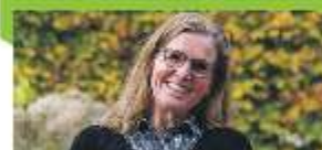
Onky Donky P11